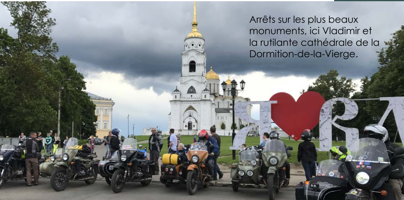
Arrêts sur les plus beaux monuments, ici Vladimir et la rutilante cathédrale de la Dormition-de-la-Vierge.

Flânez au marché de Suzdal, offrant la possibilité de goûter aux saveurs locales. Dénichez des souvenirs de Russie pour quelques roubles.